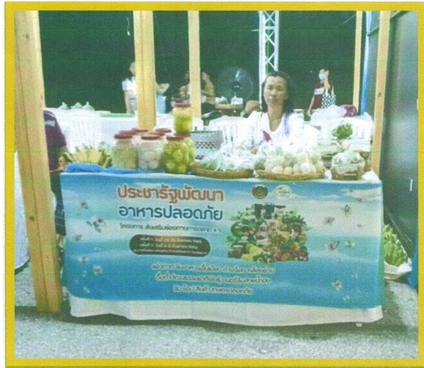
ภาพผลงาน