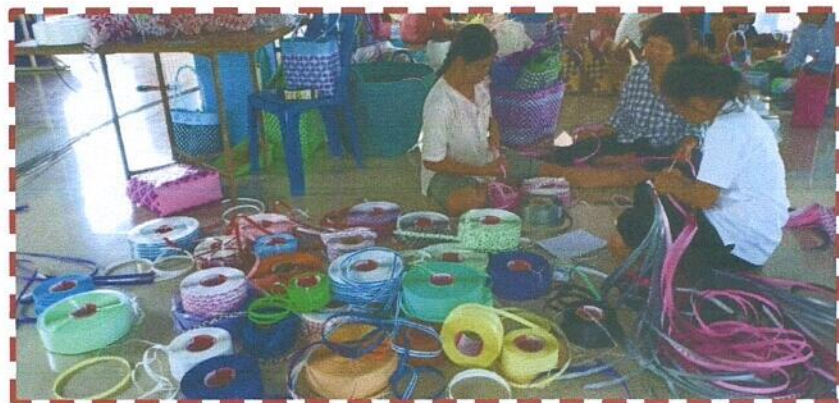
ภาพที่อยู่