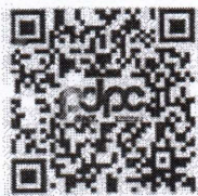
แบบแจ้งข้อมูลฯ

สำนักงานเลขาธิการกรม กลุ่มงานประชาสัมพันธ์ โทร ๐ ๒๒๕๑ ๕๐๐๐ ต่อ ๑๒๖๗ โทรสาร ๐ ๒๒๕๑ ๕๐๑๕ ไปรษณีย์อิเล็กทรอนิกส์ dla0801.3pr@gmail.com