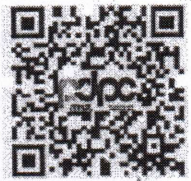
กลุ่มไลน์ประสานงาน