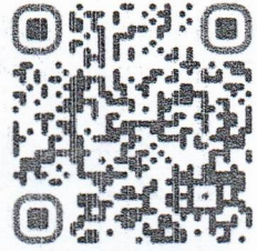
ลงทะเบียน