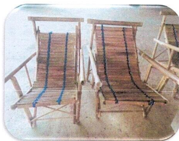
ภาพผลงาน

รูปแบบของกรรมวิธีการผลิตและรูปแบบสินค้าถูกปรับให้สอดคล้องตามความต้องการกลุ่มลูกค้าและผู้ใช้งาน มากขึ้น การผลิตงานหัตถกรรมจักสานของชาวบ้านในอดีต สามารถผลิตได้แบบเบ็ดเสร็จ ทั้งกระบวนการ ตามความ ชำนาญเฉพาะตน ตั้งแต่การเตรียมวัตถุดิบ การทำโครงสร้าง การจักตอก การสาน และการประกอบขึ้นเป็นงานที่สมบูรณ์วัสดุอุปกรณ์การจักสานไม้ไผ่ เครื่องมือในการผลิตหัตถกรรมจักสาน มีการทำใช้สืบ ต่อกัน มาแต่โบราณ มีการเปลี่ยนแปลงวัสดุ รูปแบบ บ้างตาม ความต้องการของช่างและเทคโนโลยีที่เปลี่ยนแปลงไป ประกอบด้วย ไม้ไผ่ กรรไกร ค้อน มีดอโต้สำหรับผ่าไม้ไผ่ เชือก สารตอกกันเป็นแก้อี