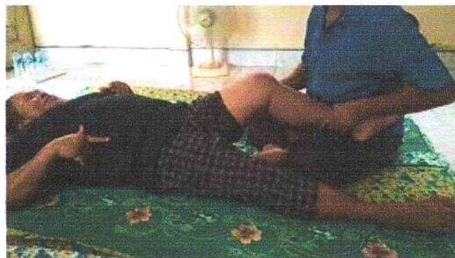
การนวดบริเวณขา