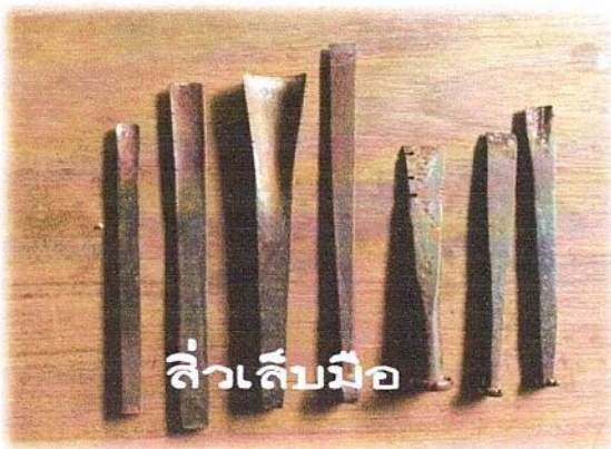
ลีวเล็บมือ