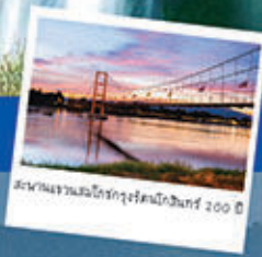
สะพานพระบรมโกศกรุงรัตนโกสินทร์ 200 ปี