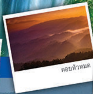
คอยหัวหมด