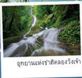
อุทยานแห่งชาติคลองวังเจ้า