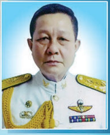
พลโทสัมพันธ์ ศรีราชบัวผัน