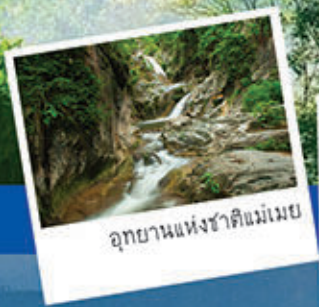
อุทยานแห่งชาติแม่เมย