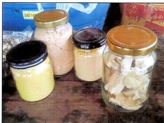
ยาสมุนไพรแบบผง