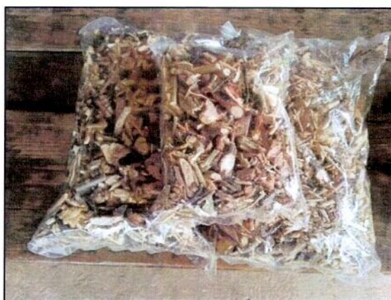
ยาสมุนไพรแบบต้ม